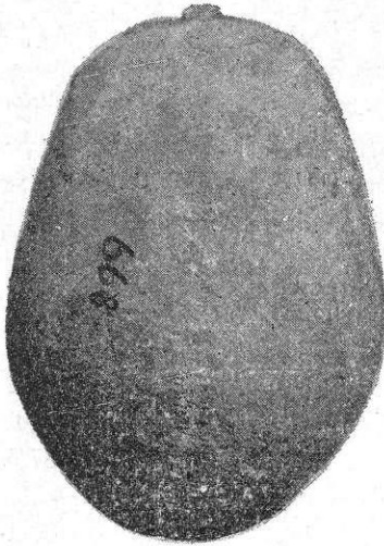
Fig. 4. — Pentagonoides .

Questa forma così caratteristica, specialmente alla norma lateralis e verticalis , che nella nostra collezione raccoglie la maggior schiera, dopo la varietà Ellipsoides ed Ooides , non era ancora stata rinvenuta in Sardegna. È un cranio elattocefalo (tranne la sottovarietà P. acutus ), ortognato, di quella struttura delicata ed elegante a cui abbiamo accennato già per forme precedenti. Mesorrino, mesoconco.