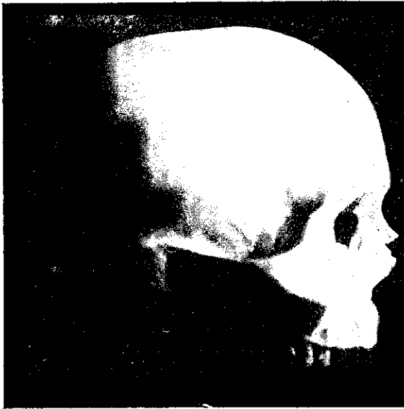
Fig. 1. — Cuboides magnus